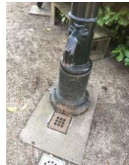
De Jan Erren waterpomp

Naast de urnenmuur staat ons nieuwe onderkomen, de 'Bergplaats', de officiële naam van dit multifunctionele gebouw. In het gebouw vergadert het bestuur en kunnen gasten worden ontvangen. Ook is het archief van onze begraafplaats hier ondergebracht. Het staat op de plaats waar vroeger het 'lijkenhuisje' stond. Dat is afgebroken in de tijd dat de begraafplaats in verval raakte en dreigde geruimd te worden. Dat dat niet gebeurd is, is te danken aan een stel parochianen onder aanvoering van Jan Erren, wiens naam voor altijd verbonden blijft aan deze begraafplaats.