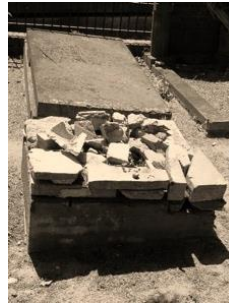
het graf toen

Het graf van deze beroemde operazangeres was helemaal vervallen en is in 2013 in ere hersteld door steenhouwer Rob van Dis door een afbeelding van het oorspronkelijke monument op een stèle te etsen. Lees het opschrift op de plaat onder de stèle dat begint met 'Ihr Lied war gross und gross ihr Leid'. Een prachtige dramatische tegenstelling.