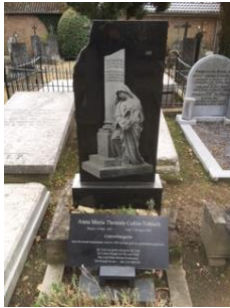
het graf nu