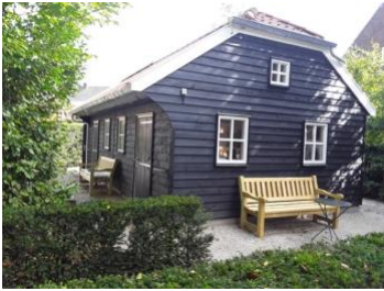
De 'Bergplaats' in 2021

overledenen te gedenken kan men via de website een gedenkplaatje kopen dat in de boom komt te hangen.